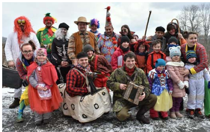
Masopust 2022 – Michalov