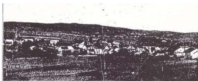
Celkový pohled na Královský Hvozď Stachy.

„Králováci, vlasti stráž, čím jste byli, budme zas!“