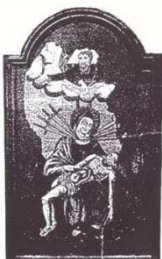
Starý obraz Bohorodičky Panny Marie v stachovské kapli.

Dne 3. srpna objevila se hlava Bohorodičky, dne 5. srpna zelený polštář sametový a nohy Panny Marie a pravá ruka Kris-