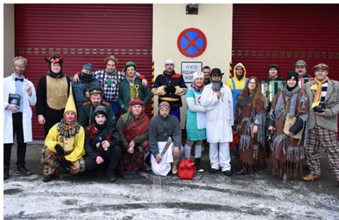
Masopust 2022 – Stachy