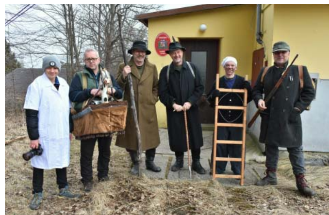
Masopust 2022 – Jaroškov