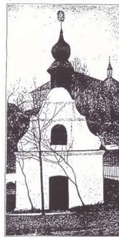
Stachovská kaple Sedmibolestné Panny Marie.

založené knížetem Břetislavem v jedenáctém století. I první náš kostelíček, nyní hřbitovní vystavěný v roce 1781, byl jí zasvěcen. Jakou láskou Inuli naši předkové k Bolestné Panně Marii, vidno z toho, že sotva kostel byl dostavěn, již opět sbírali milodary a vystavěli, (ačkoliv tehdy byla velká drahota, stálat měřice žita 12 zl.) v roce 1808 kapličku v románském slohu ke cti a chvále